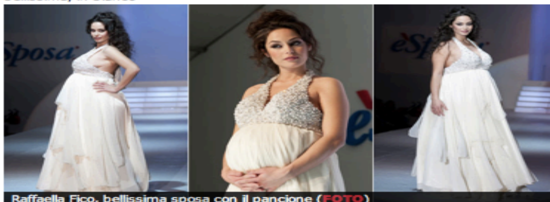
Raffaella Fico, bellissima sposa con il pancione (FOTO)

La showgirl insiste: "Mario Balotelli mi sposerà presto". E per "ingolosirlo" sfila, bellissima, in bianco